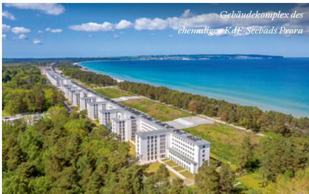
Gebäudekomplex des ehemaligen KdF-Seebads Prora