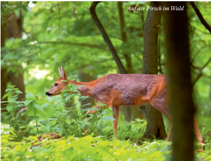
Auf der Pirsch im Wald

Anmerkung Bitte festes Schuhwerk mitbringen. Anmeldung erforderlich