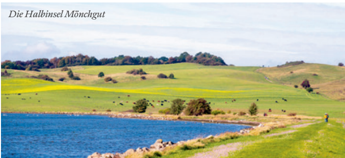
Die Halbinsel Mönchgut