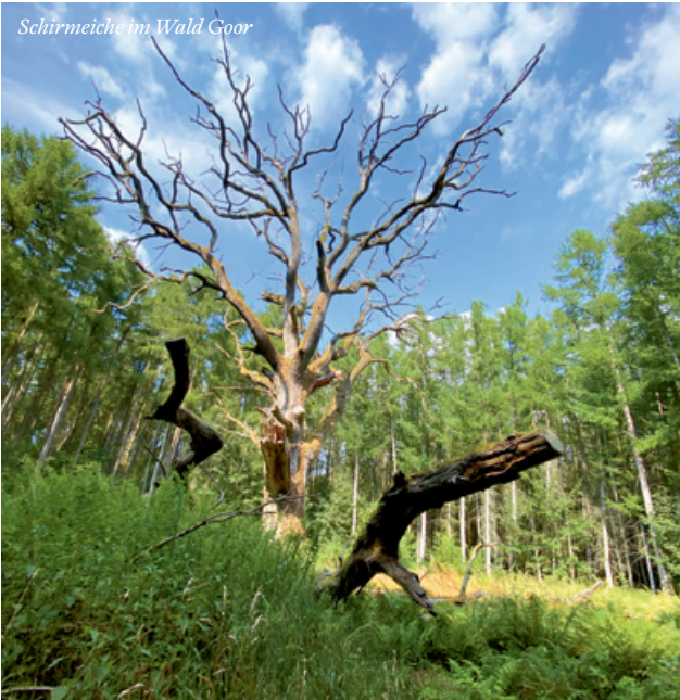
Schirmleiche im Wald Goor