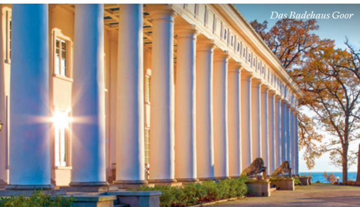
Das Badehaus Goor