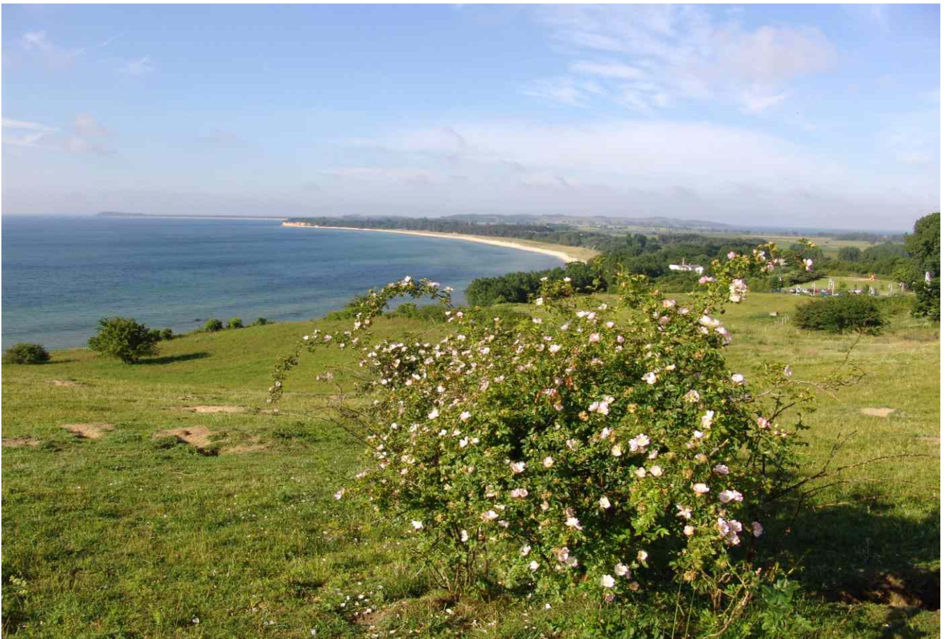
Ist-Zustand (Foto 2008)