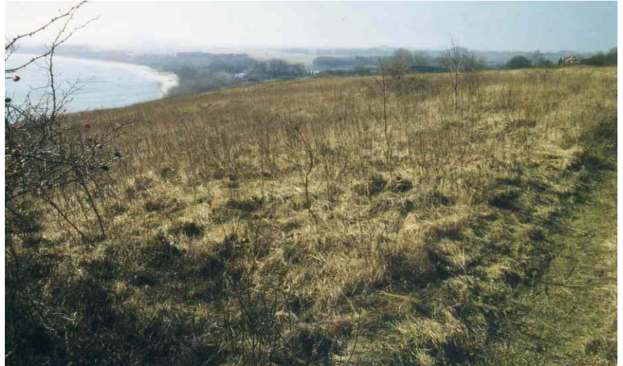
vor der Entbuschung (1998)