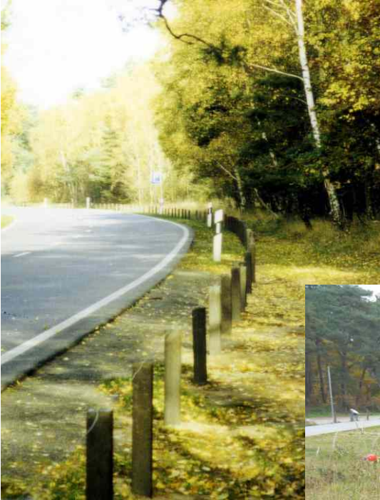
Absperrungen an der Landesstraße 2001 und 2008