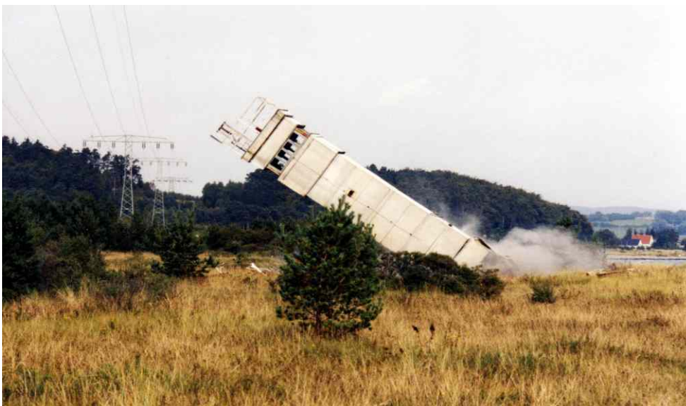
zurück gebauter Grenzwachtturm